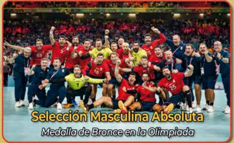
Selección Masculina Absoluta Medalla de Bronce en la Olimpiada