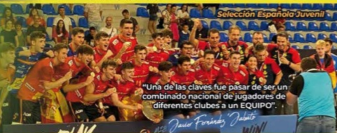
Selección Española Juvenil

"Una de las claves fue pasar de ser un combinado nacional de jugadores de diferentes clubes a un EQUIPO".