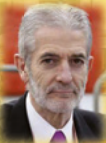
Ramón Gallego Ex Presidente de la Comisión de Reglas IHF.