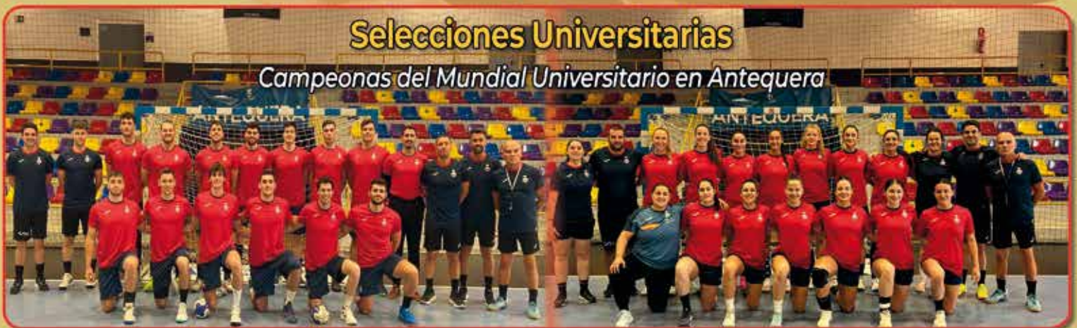
Selecciones Universitarias Campeonas del Mundial Universitario en Antequera