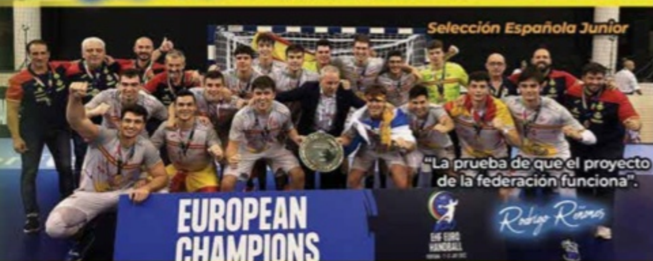
Selección Española Junior

"La prueba de que el proyecto de la federación funciona".