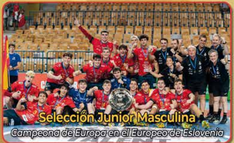
Selección Junior Masculina Campeona de Europa en el Europeo de Eslovenia