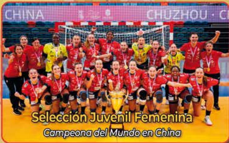
Selección Juvenil Femenina Campeona del Mundo en China