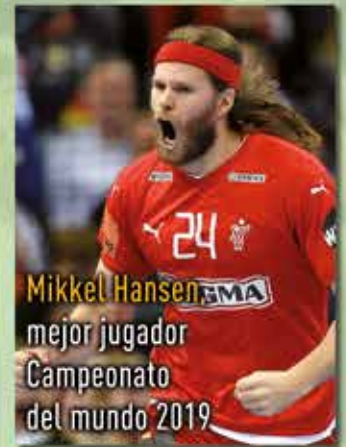
Mikkel Hansen mejor jugador Campeonato del mundo 2019