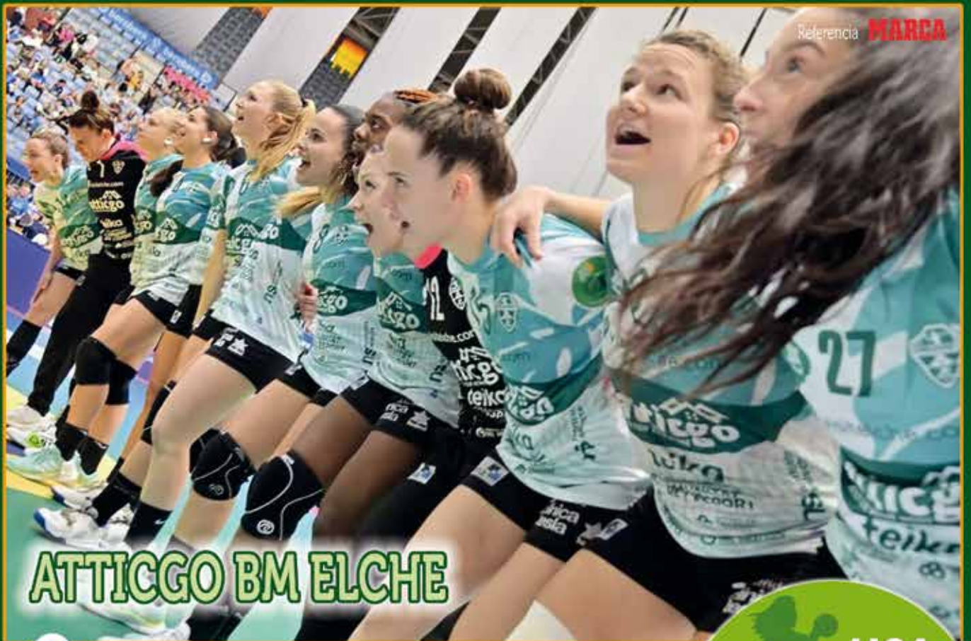
ATTICGO BM ELCHE