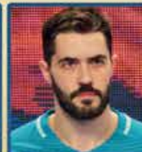
Raúl Entrerrios Gijón