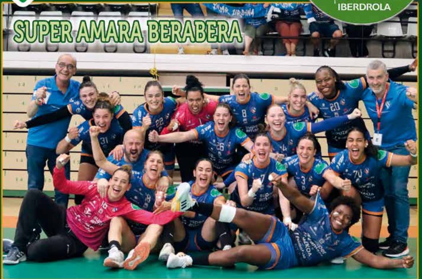
SUPER AMARA BERABERA