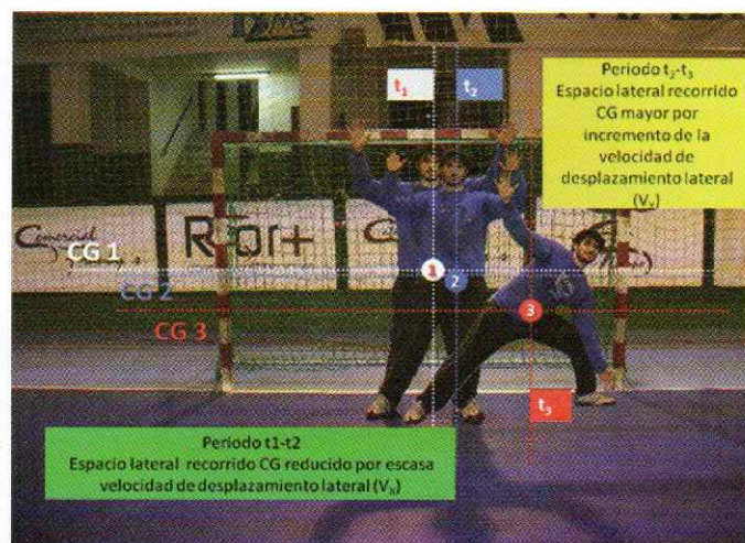
Figura 1.- Representación esquemática de las diferentes posiciones que ocupa el CG del portero en diferentes momentos de la ejecución del lanzamiento.

4. Los porteros de balonmano ralentizan su desplazamiento en los primeros momentos de la intervención, al objeto de no desvelar al lanzador hacia que lado de la portería se dirige (figura 1). Se adoptan ciertas precauciones que les permite ser más eficaces en la localización del lanzamiento, evitando que el lanzador la modifique y en su caso poder cambiar la dirección de su desplazamiento.